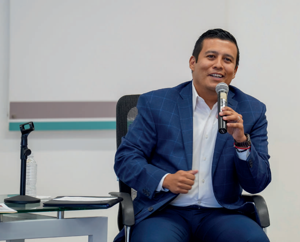
Lic. Miguel Ángel Vázquez Placencia, Director General de Promoción y Seguimiento al Combate a la Corrupción de la Contraloría del Estado de Jalisco.