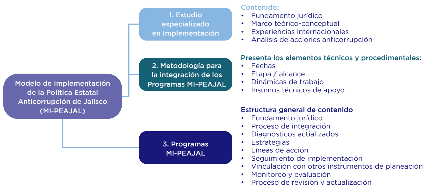
Figura 1. Modelo de Implementación de la PEAJAL