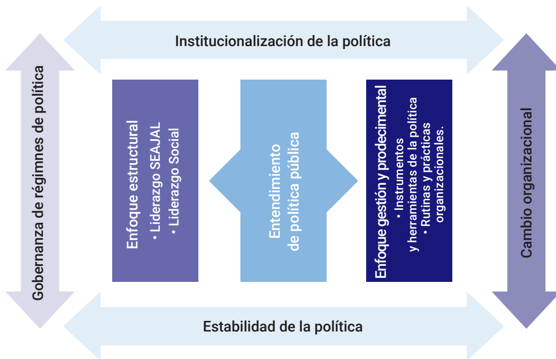
Figura 2. Propuesta teórica-conceptual implementación de política pública