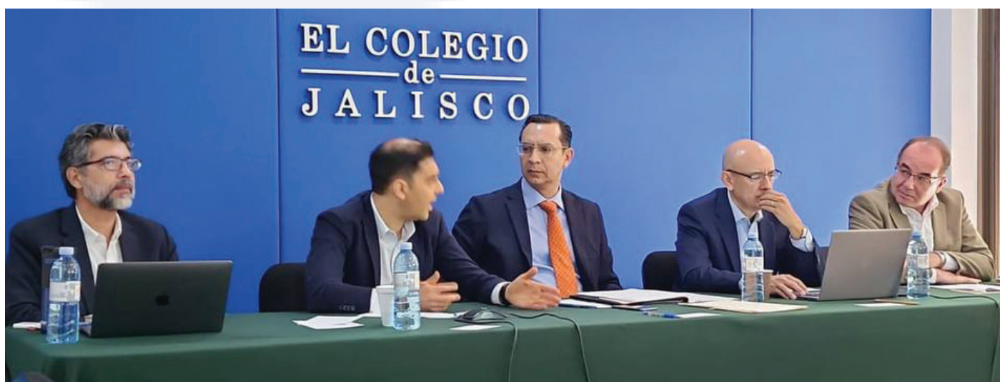
Participantes de la Mesa 1 de la Semana de la Evaluación gLOCAL en El Colegio de Jalisco.

Se enfatizó que la evaluación al Sistema Nacional Anticorrupción, debe darse en lo cuantitativo y en lo cualitativo, con la ayuda de nuevas metodologías que recojan datos con un enfoque