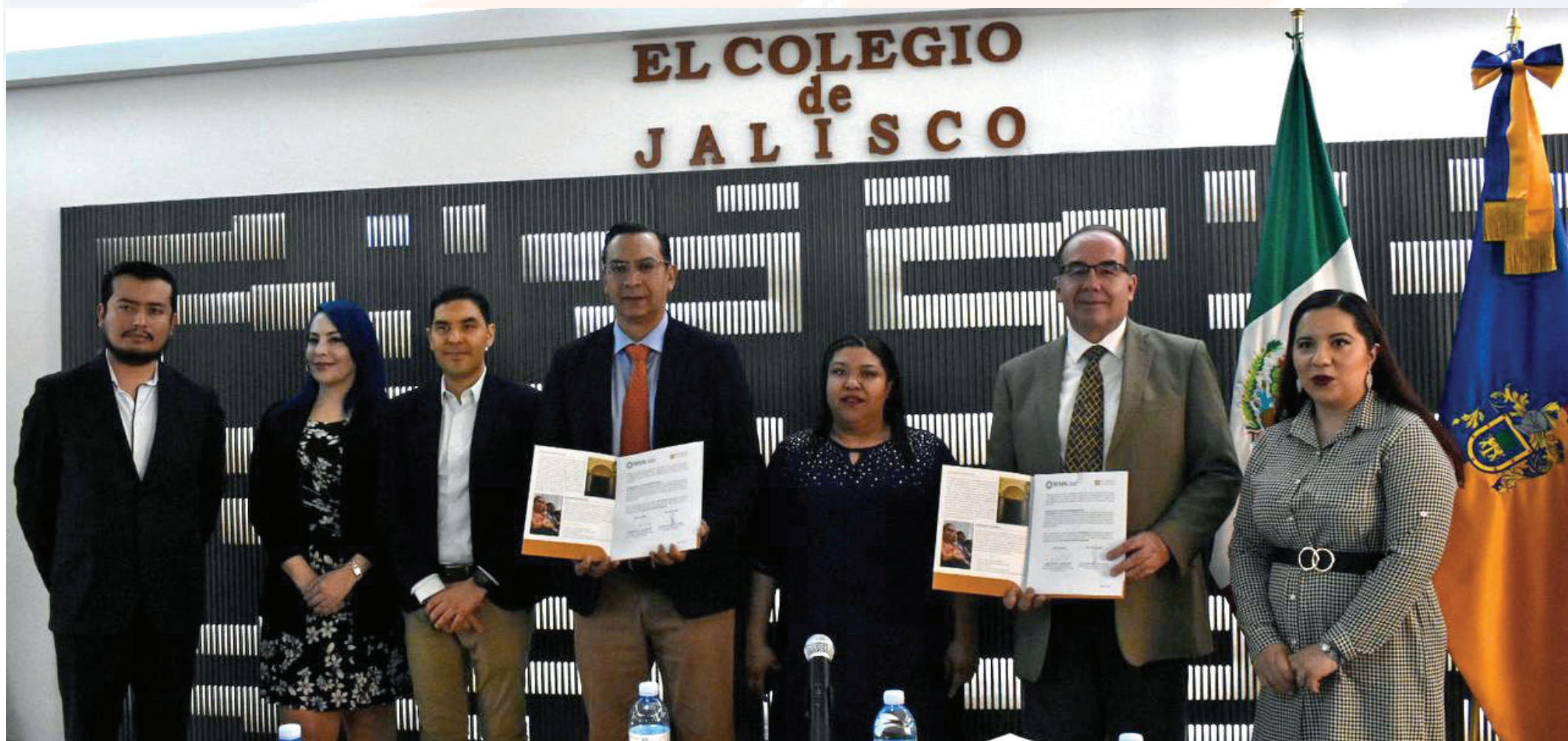
Autoridades del SEAJAL, de la SESNA y de El Colegio de Jalisco, presentes en la renovación del convenio de colaboración entre la SESAJ y esta institución académica.