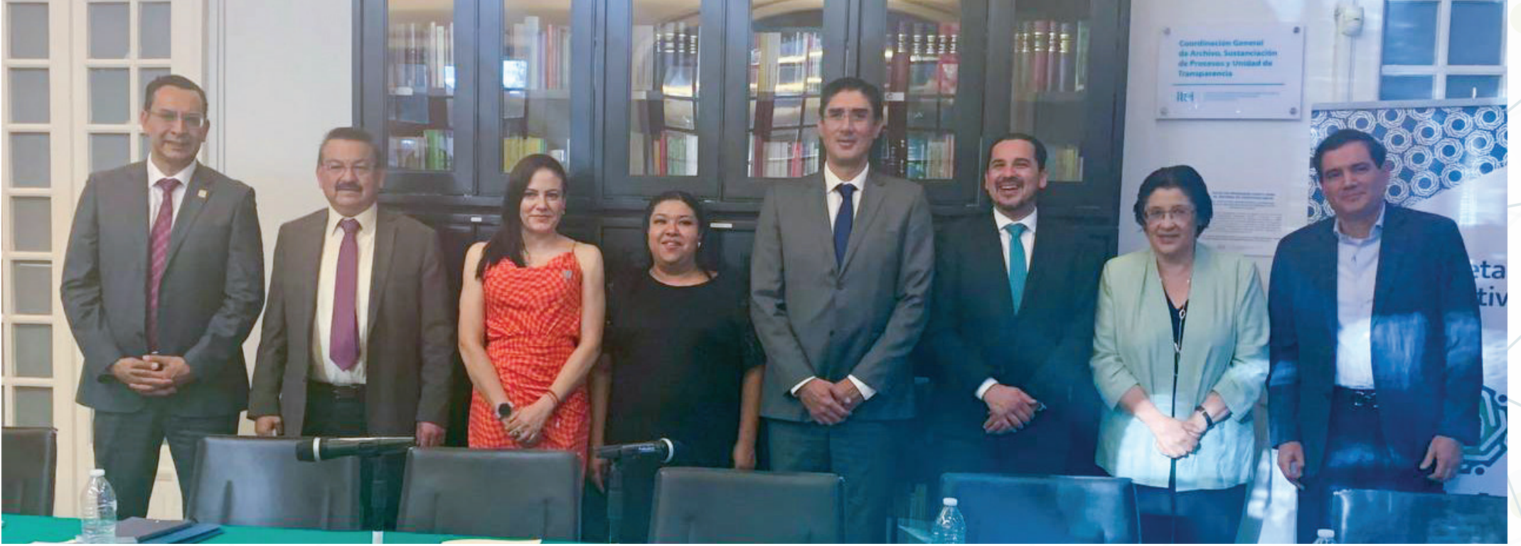
El Comité Coordinador aprobó dos instrumentos clave para que cerca de 500 entes públicos comiencen a implementar acciones anticorrupción.

Son cerca de 500 entes públicos en Jalisco los que tendrán acceso a herramientas para cumplir con la implementación de los cuatro programas ejes de la Política Estatal Anticorrupción (PEAJAL), luego de que el Comité Coordinador del Sistema Estatal Anticorrupción (SEAJAL) aprobara en sesión ordinaria las Guías de Implementación –Estatad y Municipal– de los Programas MI-PEAJAL y la Guía Metodológica para la Formulación de los Programas Institucionales Anticorrupción (PIA).